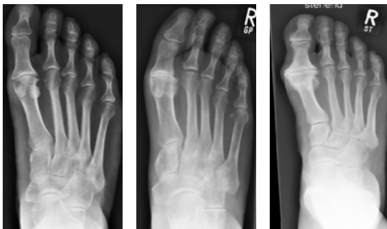
Röntgen-Stadien der Großzehengrundgelenksarthrose